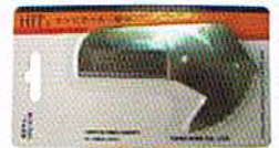
VPCC 42 SR